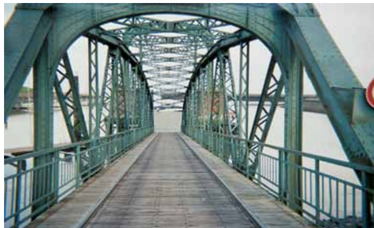
Eröffnung am Freitag, 8. März, 15 Uhr

Am 21. März eröffnet die Foto-Ausstellung "Glaube, Liebe, Hoffnung. (M)eine Sicht auf Wilhelmshaven" in der St.-Cosmas-und-Damian-Kirche zu Bockhorn. Das integrative Bilderprojekt geht der Frage nach, wie Menschen leben und auf die Jadestadt Wilhelmshaven und ihre zum Teil neue Heimat sehen.