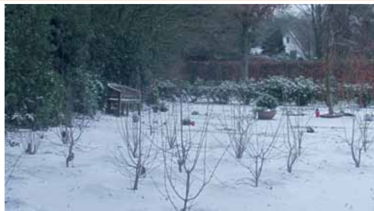
Foto: Noch im Schnee, aber zur Blütezeit bieten heimische Sträucher Nahrung für Insekten, AF

Seitdem die Wege des Neuenburger Friedhofs instandgesetzt wurden, sind weitere Veränderungen vorgenommen worden. Es gibt endlich neue Gießkannenständer, die Schilder an den Abfallbehältern wurden erneuert. Die verkümmerte Ecke mit den Rhododendren am Ende des Hauptweges wurde gerodet und komplett durch heimische Gewächse ersetzt. Sie laden im Frühjahr viele Schmetterlinge, Bienen, Hummeln und andere Insekten zum Auftanken und Bestäuben ein. Auf kleineren Freiflächen wurden ebenfalls insektenfreundliche Sträucher gepflanzt. So zum Beispiel in Nähe der Kriegsgräber.